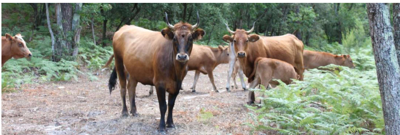
Troupeau actuel de vaches Marine Landaise en forêt dans les Landes de Gascogne.

Les zootechniciens du début du XXe siècle citent à leur tour la race (Diffloth 1914, Dechambre 1920), mais, à cette époque, la population est déjà en grand déclin, chassée des terres communales par les plantations de pins. En 1930, les bovins landais du Médoc furent abattus à Hourtin alors que ceux de La Teste et Cazaux ont disparu vers 1948. Les derniers bovins sauvages vécurent dans une emprise militaire de plusieurs milliers d'hectares en forêt de Biscarrosse jusque vers 1965, avant d'être supprimés. La race sera alors considérée comme éteinte jusqu'à ce que, en 1987, soit retrouvé et identifié dans un domaine forestier un petit troupeau qui avait été constitué dans les années 1940 à partir d'animaux de la forêt de Biscarrosse toute proche.