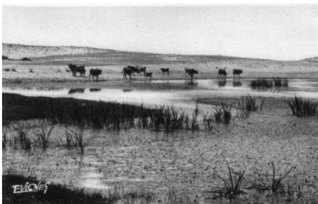
Photo d'archives du troupeau de vaches Marines Landaises sur la côte Atlantique

Historique : Les vaches marines landaises ont longtemps vécu en liberté dans les dunes et les landes de la côte atlantique de Gironde et des Landes. Souvent sauvages ou parfois propriété collective des habitants, les animaux étaient capturés pour la consommation ou dressés pour le travail. Vers 1690, Claude Masse, effectuant une cartographie du littoral aquitain, signale la présence de vaches et de chevaux errants dans les dunes. En 1739, l'intendant de la ville de Bordeaux écrit : « Les bœufs et les vaches sont tout à fait sauvages [dans] les montagnes de sable tout le long de la côte et toute l'année dehors. » En 1800, Brémontier, dans son étude sur la fixation des dunes, précise que les vaches sont absolument sauvages et sont tirées au fusil.